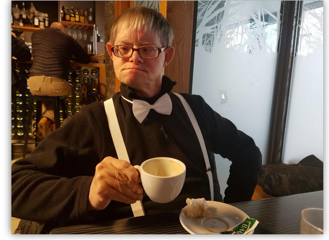
Blanco C. (2017). Carnavales 2017. XV Concurso de Fotografía Digital del Inico-Fundación Grupo Norte. Recuperado de: http://album-inico.usal.es/fotografia.aspx

La esperanza de vida de las personas con discapacidad intelectual (DI) ha aumentado exponencialmente en las últimas décadas (Coppus, 2013; Northway, Jenkins y Holland-Hart, 2017). Determinadas enfermedades propias del proceso de envejecimiento aparecen con anterioridad en las personas con DI, en muchos casos incluso antes de los 40 años (Lin, Lin y Hsu, 2016). El objetivo de este trabajo es describir la frecuencia de demencia tipo Alzheimer en una muestra española de personas mayores de 45 años con distintos niveles de DI.