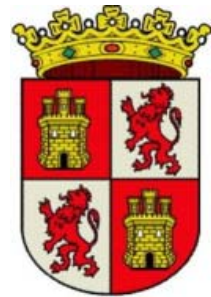
Escudo de Castilla y León

El día que todos celebramos la fiesta de Castilla y León es el 23 de abril.