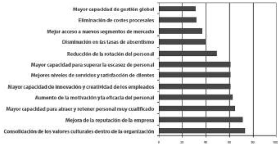
FIGURA 6 EMPRESAS QUE ESTÁN APLICANDO POLÍTICAS DE DIVERSIDAD. BENEFICIOS OBTENIDOS (PORCENTAJE DE EMPRESAS QUE CALIFICARON LOS BENEFICIOS COMO IMPORTANTES O MUY IMPORTANTES)