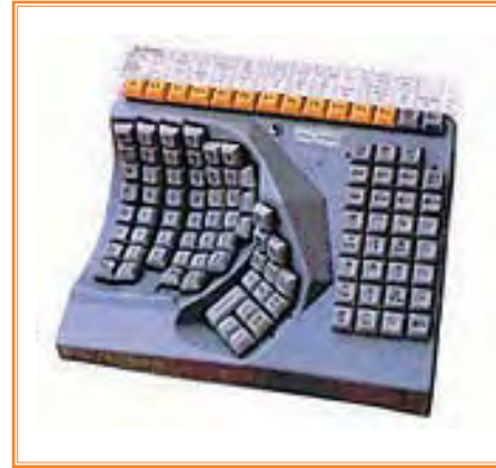
Teclado para una sola mano

Es innegable que la era industrial permitió, a medida que mejoraban las técnicas médicas y se aplicaban tecnologías de otras ramas, incorporar elementos muy especializados, primero sólo como órtesis y prótesis y, posteriormente, como ayudas técnicas o productos para rehabilitación, que compensaban las deficiencias para la realización de las actividades cotidianas permitiendo la aparición paulatina, la participación e implicación de las personas con discapacidad en la sociedad. Sin embargo, las dificultades planteadas por el medio físico, por el entorno construido, por los diseños de los productos y los servicios, eran, y, a veces, son, de tal naturaleza que unas veces no se encontraba la solución técnica y otras se aducía que resultaba excesivo el coste y el mantenimiento de productos que las salvaran.