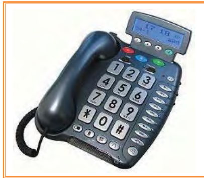
Teléfono para personas con deficiencias auditivas

Este nuevo concepto de banca dio sus primeros pasos en España a principios de los 90 y ha ido evolucionando con el desarrollo de las nuevas tecnologías. En un primer