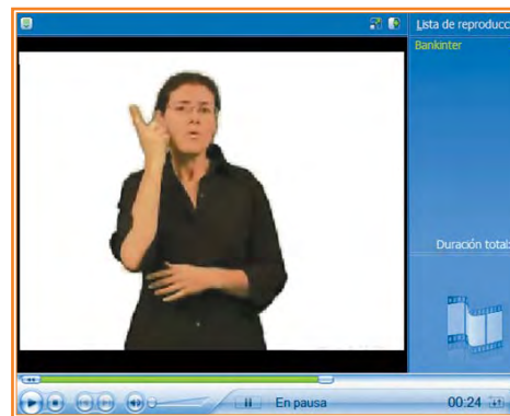
Videoconferencia en lengua de signos

Para resolver las dificultades de accesibilidad que se encontraron a medida que se extendía el uso de Internet, nació la Web Accessibility Initiative (Iniciativa de Accesibilidad Web) , conocida como WAI por sus siglas en inglés. Se trata de una actividad desarrollada por el World Wide Web Consortium -W3C- , que tiene como objetivo "facilitar el acceso de las personas con discapacidad, desarrollando pautas de accesibilidad, mejorando las herramientas para la evaluación y reparación de accesibilidad web, llevando a cabo una labor educativa y de concienciación en relación a la importancia del diseño accesible de páginas web, y abriendo nuevos campos en accesibilidad a través de la investigación en esta área".