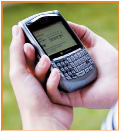
Acceso a Internet a través de PDA

El móvil es uno de los canales a distancia más innovadores de la banca actual. Se comentaba en el año 2005 en un encuentro celebrado entre los principales bancos españoles y compañías de telecomunicaciones -operadoras de telefonía móvil- que se trataba de convertir cada teléfono móvil en una pequeña oficina, en un instrumento integral de prestación de servicios financieros.