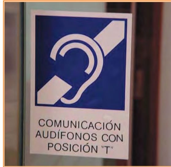
Señal que indica la existencia de bucle magnético.

Caja Navarra, Caja España, Caja de Ahorros de la Inmaculada, Deutsche Bank y La Caixa han centrado una parte de sus esfuerzos en la aplicación de estrategias de comunicación para la atención a personas con deficiencias auditivas. Mientras las primeras han optado por la atención personalizada, incorporando soluciones para la comunicación con personas sordas a través de intérpretes de lengua de signos o de trabajadores que conocen esta lengua, Deutsche Bank y la Caixa han comenzado a instalar en sus oficinas bucles magnéticos para personas sordas que utilizan audífono o implante coclear.