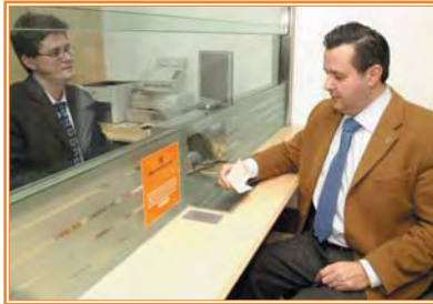
Mostrador de caja: altura e iluminación adecuadas

Los mostradores deberán ser accesibles disponiendo de varias alturas entre 1,10 y 0,80 m y de espacio inferior libre para permitir la aproximación del usuario.