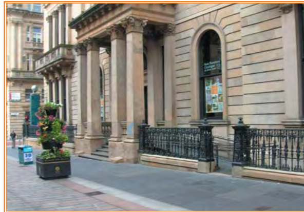
Oficina bancaria con acceso mediante rampa lateral, adaptación que mantiene el estilo y estética del edificio.

En la misma línea y desde hace ya años las entidades bancarias transformaron su manera de trabajar y han venido siendo importantes usuarios de esas tecnologías de la comunicación y la información -TIC- por el importante papel que juegan para el desarrollo de su actividad empresarial. Han sido estas tecnologías, sin duda, las que han contribuido de forma extraordinaria a la globalización de la economía de la que estas entidades son agentes fundamentales. Y, aunque incorporaron más tarde la aplicación de esas tec-