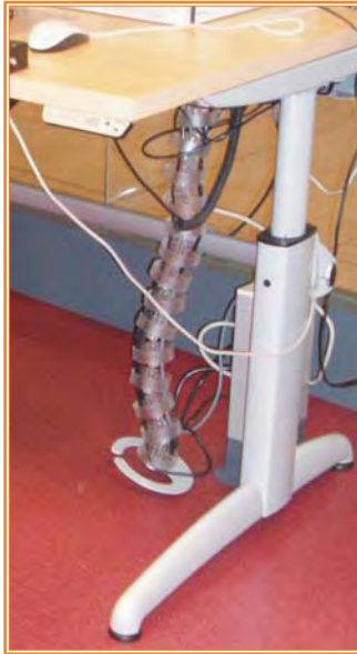
Mesa regulable en altura

3. Sencillez y comprensión intuitiva: El uso del producto o servicio diseñado debe ser fácil de entender independientemente de la experiencia, los conocimientos, las habilidades o el nivel de concentración del usuario.