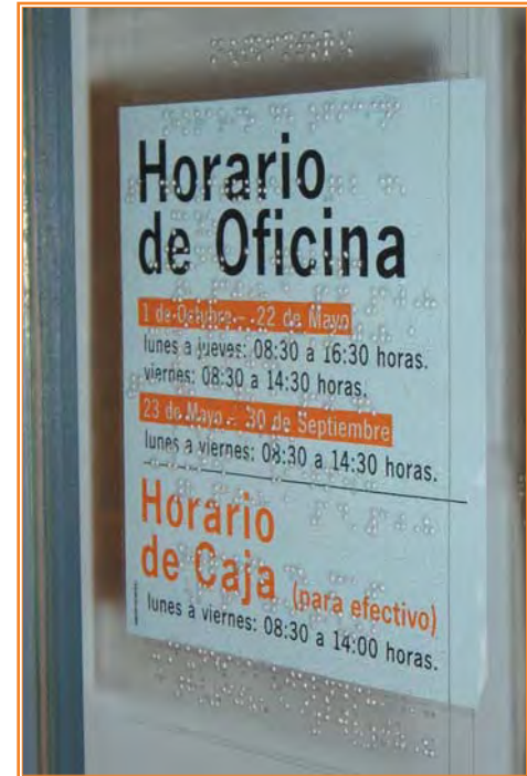
Cartel indicando horario de oficina bancaria que incorpora el texto en Braille.