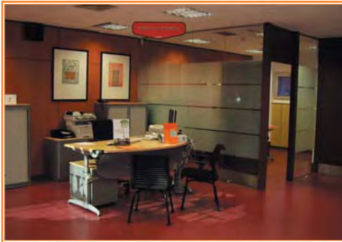
Diseño accesible de espacios interiores: pavimento, espacios libres, puertas ...

Las puertas que dan al exterior deben tener como mínimo una anchura libre de paso de 1,20 m y una altura de 2,20 m y serán fácilmente localizables -contraste de color con los paramentos, señalización con bandas de colores o con los logotipos de la entidad...- y cumplirán los requisitos que se recogen más adelante.