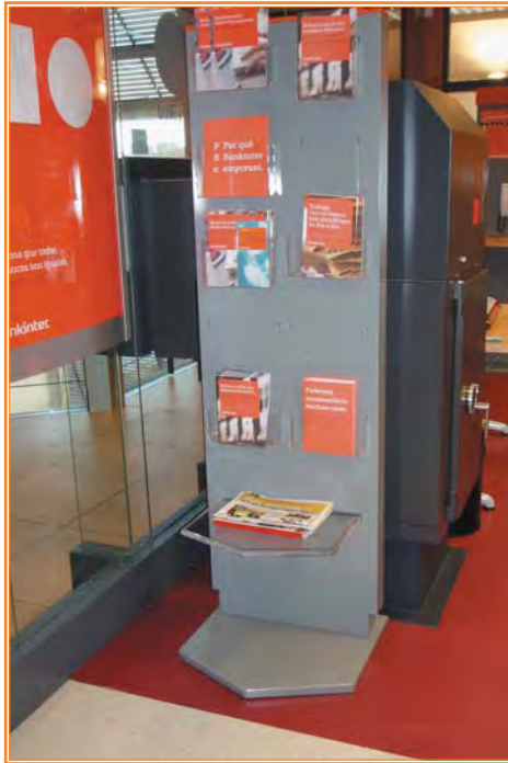
Diferentes alturas y contraste de color del expositor incorporado en la oficina accesible.

Fruto del convenio de colaboración con Fundación ONCE, Bankinter cuenta en Madrid con una oficina prototipo de accesibilidad. Se diseñó teniendo en cuenta: la disposición y dotación de los espacios, el mobiliario, la infraestructura tecnológica, la formación del personal de atención al cliente, etc. La oficina cuenta con ordenadores habilitados con lectores de pantalla, programas de síntesis de voz y magnificador de pantalla; con vídeos en lengua de signos; con servicio de interprete de lengua de signos; y con bucle magnético y amplificador de audio en el servicio de caja. El cajero de esta oficina permite el acceso a personas que utilicen silla de ruedas y está dotado de un software de voz para personas con discapacidad visual que, en el momento en el que se insertan los cascos ad hoc, deja en negro la pantalla e informa verbalmente dando instrucciones precisas para que se pueda operar con total confidencialidad. Todos los empleados que gestionan esta oficina son personas con discapacidad.