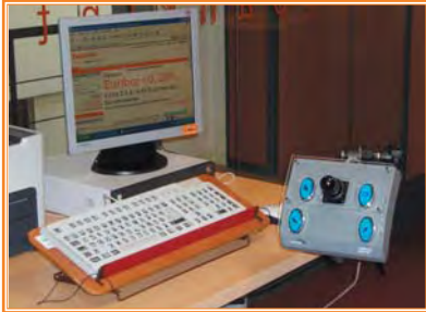
Dispositivos de acceso a Internet: emulador de ratón, teclado adaptado con macrocaracteres y braille situados en una mesa regulable en altura.

Además resulta conveniente señalar la utilidad de los bucles magnéticos, tanto los fijos que son los que se instalan habitualmente en las zonas de caja -cuando incorporan cerramiento acristalado-, como los móviles -trasladables u utilizables en cualquier mesa o espacio de atención a clientes- que permiten atender a las personas que utilizan audífonos -con posición T-. Estos dispositivos tienen un coste relativo muy bajo en relación al beneficio que pueden proporcionar en la comunicación con clientes con deficiencias auditivas usuarias de audífonos -tanto personas con discapacidad como personas mayores-.