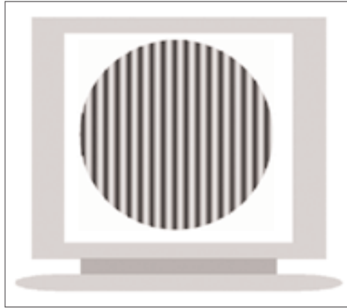
Figura 2. Motion-onset paradigm . Este paradigma o tarea se utiliza frecuentemente en los estudios de procesamiento visual, se presenta en ordenador y se puede programar para ajustar la resolución temporal, la frecuencia espacial, el contraste y la luminosidad. El movimiento de las rejillas es más difícil de detectar por los sujetos con dislexia cuando se presenta con baja frecuencia espacial, bajo contraste, baja luminosidad y resolución temporal rápida.

para discriminar cambios rápidos o sucesivos de estímulos, tanto en la modalidad visual como auditiva.