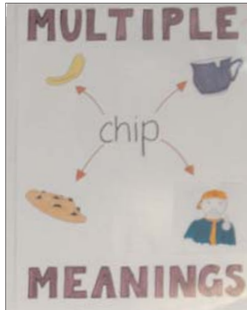
Figura 4. Actividad de análisis semántico del programa RAVE-O ( Retrieval, Automaticity, Vocabulary, Elaboration, Orthography ) basado en el desarrollo de la fluidez lectora [75].

Resulta complicado interpretar exactamente los resultados de los estudios de neuroimagen debido a que, en muchas ocasiones, las tareas utilizadas requieren que diferentes tipos de procesamiento (fonológico, visual y auditivo) se produzcan simultánea y coordinadamente. Las tareas de procesamiento fonológico más comúnmente usadas en los estudios previamente citados dependen de estímulos auditivos o impresos que, a su vez, requieren de la interpretación de formas ortográficas. Estas tareas pueden resultar problemáticas por razones teóricas y empíricas. Por ejemplo, la baja activación cerebral mostrada por los dislé-