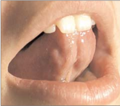
Figura 1. Fotografía de la posición de los labios y la lengua para pronunciar los sonidos dentales /d/ y /t/. Diferentes programas fonológicos muestran estas fotos al niño para hacerle consciente de cómo se forman los sonidos en su boca. El objetivo es que el niño integre la información recibida usando diferentes sistemas: el nombre de la letra (auditivo), cómo se escribe (visual) y cómo se pronuncia (motriz), de ahí el carácter 'multisensorial' de estos programas.